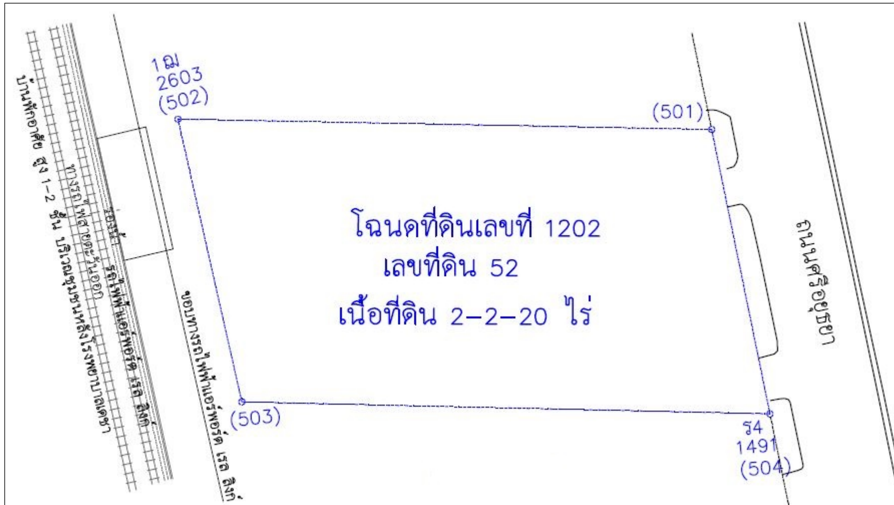
รูปที่ 1.2-1 แสดงผังต่อโฉนดที่ดิน