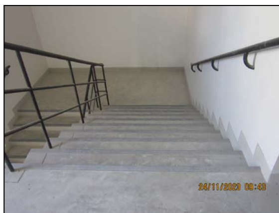
ภาพที่ 1.6-1 สถานภาพโครงการปัจจุบัน